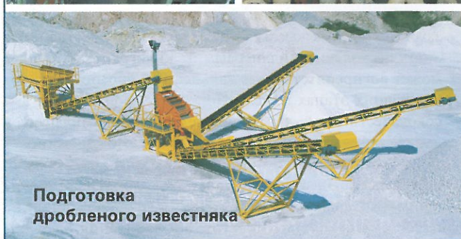
Подготовка дробленого известняка

Сортировочные машины и механические грохоты производства компании Mogensen. Более чем 40 летний опыт в области технологий производственных процессов, а также применяемая нами испытанная технология гарантируют вам оптимальную производительность и надежность наших машин.