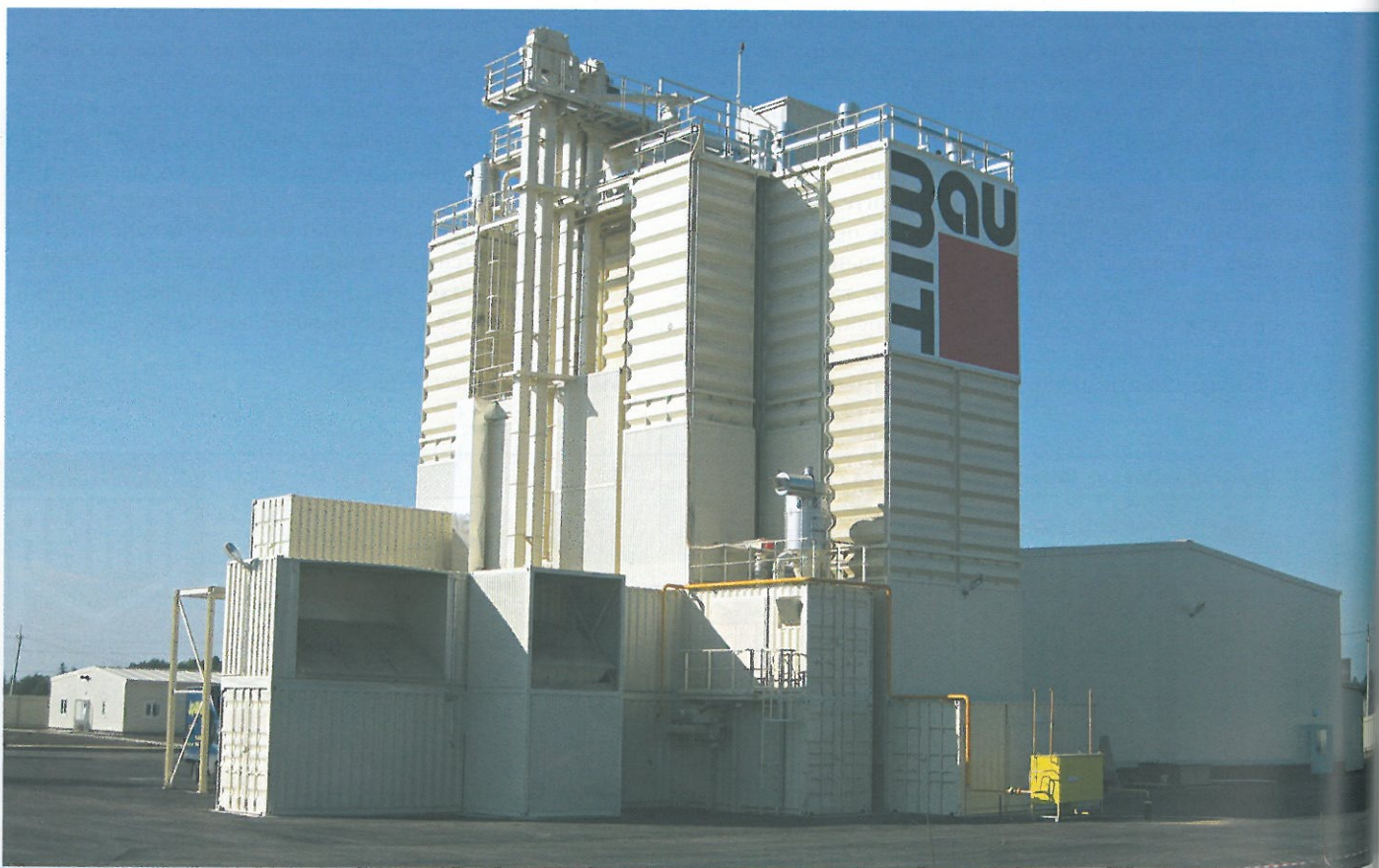
1 Фирма БТ-Вольфганг Биндер ГмбХ сооружает заводы по производству сухих строительных смесей в России

О том, что такой принцип создания заводов наилучшим образом зарекомендовал себя на рынке, свидетельствует тот факт, что один из крупных немецких концернов по производству строительных смесей поручил фирме БТ-Вольфганг Биндер ГмбХ сооружение завода в модульном исполнении на Южном Урале. Ввод его в эксплуатацию состоится в начале 2012 года.