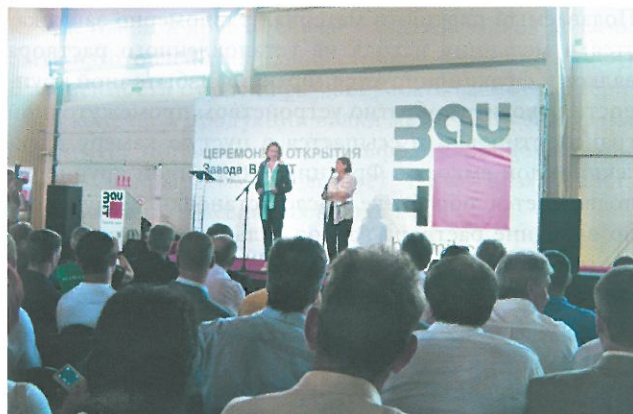
3 Открытие завода 8 июля 2011 года